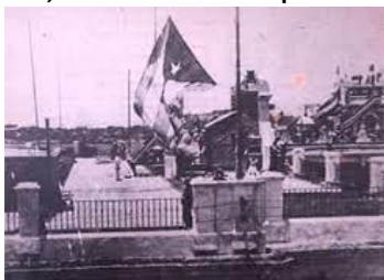
Momento en que la bandera cubana era izada el 20 de mayo de 1902.

El 20 de mayo de 1902, la República de Cuba surge lastrada en su soberanía por la interesada mediación del naciente imperialismo norteamericano. El peligro avizorado por José Martí pasa a ser realidad. Como escribió Máximo